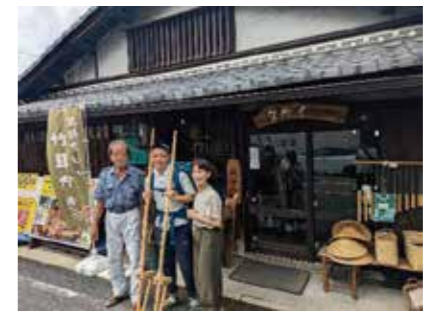
▲竹細工工房の店主のおじさんと奥さん

また、大自然も楽しんでできました。夕日で赤く染まった入道雲が浮かぶ広い空を独り占めしながら、一日歩き続けて疲れ切ったから琵琶湖で浴びる水はとても気持ち良かったです。十五夜の日には、中秋の名月を眺めながら波の音と共に眠りました。