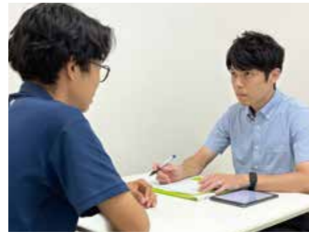
▲教室長面談の様子。志望校について真剣に話をしています。

このような現状を踏まえて、今年度はこれまでの学習指導方法を1から見直し、生徒一人一人が計画的に勉強を進めることができるように学習プランニングを行っています。具体的には、科目ごとに厳選した参考書リストに基づき、①どの参考書を②いつまでに③どのくらい④どうやって進めていくかをアドバイスします。例えば英語の場合、①英語長文ポラリス1を②8月末までに③2周する④1周目は問題を解いた上で1章ごとに理解していなかった単語・文法・文構造を確認し、2周目は1周目でチェックした内容を再度復習して定着させる といったような流れです。