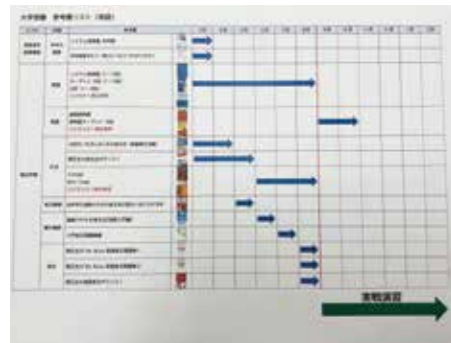
▲学習プランニングシート。いつまでに何を終わらせるかが一目瞭然!

カイチ予備校においても、数年前と比べて「年内入試」の受験者数は着実に増えています。特に私立大学を志望する生徒にとっては、年明け(1月～2月)の一般選抜に加えて11月の学校推薦型選抜を受験するのが今やスタンダードになっています。受験回数が増えるということはそれだけ合格のチャンスも広がるということなので、その意味では受験生にとってプラスに働くのは間違いのないのですが、11月に入試を受験するということはそれだけ早く学力をピークまで持っていかなければならないということを意味します。そのため、入試から逆算したスケジュールで計画的に受験勉強を進めていくことがより一層重要になってきます。