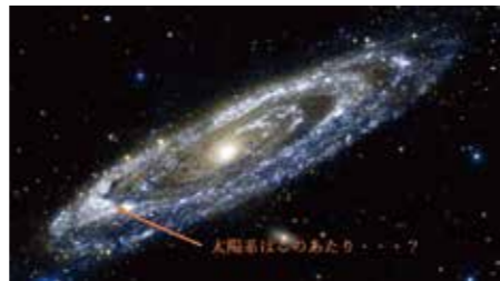
▲天の川銀河のイメージ。これが2兆個ってどんだけ・・・

「宇宙>>天の川銀河>>太陽系>>地球」ということです。地球は、宇宙全体から見れば、とても見えないような小さな小さな星です。そして自分は、地球におよそ80億人いる人間のうちの、