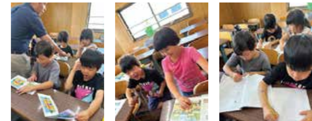
▲ reading用の絵本で単語を読めるように ▲笑顔が飛び交うレッスン ▲アルファベットをきちんと覚える