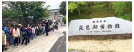
▲鮫江中学校の近くに整列! ▲いろいろな展示物に大興奮!

予報通り、朝からはあいにくの雨。バスの中では、勢いを増す雨に呆れるばかり。そんな天候とは裏腹に参加した今福教室の生徒達は元気一杯!このエネルギーがあれば、雨雲も追い払えるのではと思いました。バスの中では、なぜぞぞ大会で盛り上がりました。DAISOで購入した早押しボタンも大活躍でした(笑)。琵琶湖博物館と京都鉄道博物館に行きました。しっかりと時間を守り、ルールに従いながら行動していました。道に迷っている生徒の手を優しく握り、一緒に誘導している上級生の姿を見ると、ほっこりとした気持ちになりました。帰宅時の集合場所であった中今福公園では、たくさんの保護者の方々がお迎えにいらっしゃっていました。荒天の中にもかかわらず、本当にありがとうございました。拡声器などで保護者の方々へ感謝の気持ちと無事帰宅した報告を述べている際、私に傘を差しだしてくださった保護者の方には、本当に泣きそうになりました。今でもいい思い出に残っています。教室長として、またひとつ成長できた気がしました。