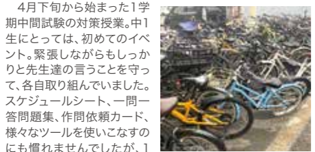
▲この自転車の量、すごい!

4月下旬から始まった1学期中間試験の対策授業。中1生にとっては、初めてのイベント。緊張しながらもしっかりと先生達の言うことを守って、各自取り組んでいました。スケジュールシート、一問一答問題集、作問依頼カード、様々なツールを使いこなすのにも慣れてくると、生徒も増えてきました。一部の中学校が5月末に中間試験があった関係で、すぐに1学期期末試験対策授業が始まりました。2か月余り、勉強漬けの毎日になってしまいました。さらに、クラブ活動が本格化した、いろいろと神経を使う日が増えました。