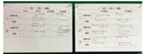
▲今年から始めた中1と中2の掲示! ▲去年から取り組んでいる中3の掲示!

できる限り空いている時間を、中3の自習室として開放します。もちろん監督の先生は常にいます。その自習室に参加する前に、この掲示板を見て中3生はメモを取り、自習に参加します。