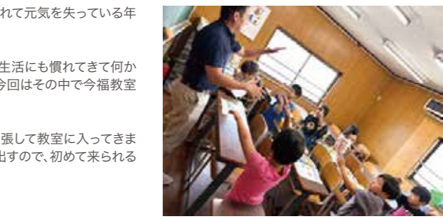
▲ I can swim! 体を使って表現を覚える

ここで学ぶ単語や文法は、英検5級クラスでも学ぶものです。先取でゆっくりなペースで学んでおくことで5級クラスへ上がったときにも高学年と生徒と同じように進んでいくことが可能になります。でも、他の習い事で忙しく、トーキングキッズの授業日と合わないという方には、数ある中で私が一押しするオンラインレッスンとコースをご紹介します。ぜひ参考にしてくださいね。