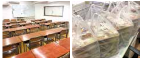
▲第3教室がオープンしました! ▲9時間自習のお弁当です!

ルーティンワークになるまでは、最低3か月はかかる、塾長は私に伝えてくださいました。本当にその通りで驚いています。自分の今までの行動を反省し、今後の行動に活かす。自分なりに行動に工夫してみよう、失敗したらやり直す。そんな切磋琢磨、研鑽を繰り返しながら頑張っています。