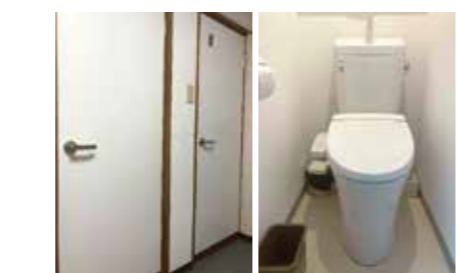
▲トイレがきれいになりました! ▲2つともウォシュレットです!

在塾生の成績を上げることが第一義です。常にいい授業をすることを目標に、我々も日々研鑽中です。至らぬことがございましたら、ご指摘いただければ幸いです。今後には活かしますので、何卒宜しくお願いいたします。これからも暑い日が続きますが、お体を大切に過ごしてください。